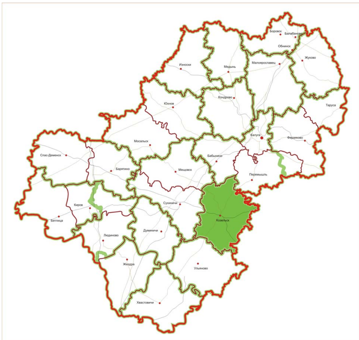
Рис. 1. Схематическая карта расположения Козельского лесничества на территории Калужской области

Границы лесничества на схематической карте Калужской области показаны на рис. 1.