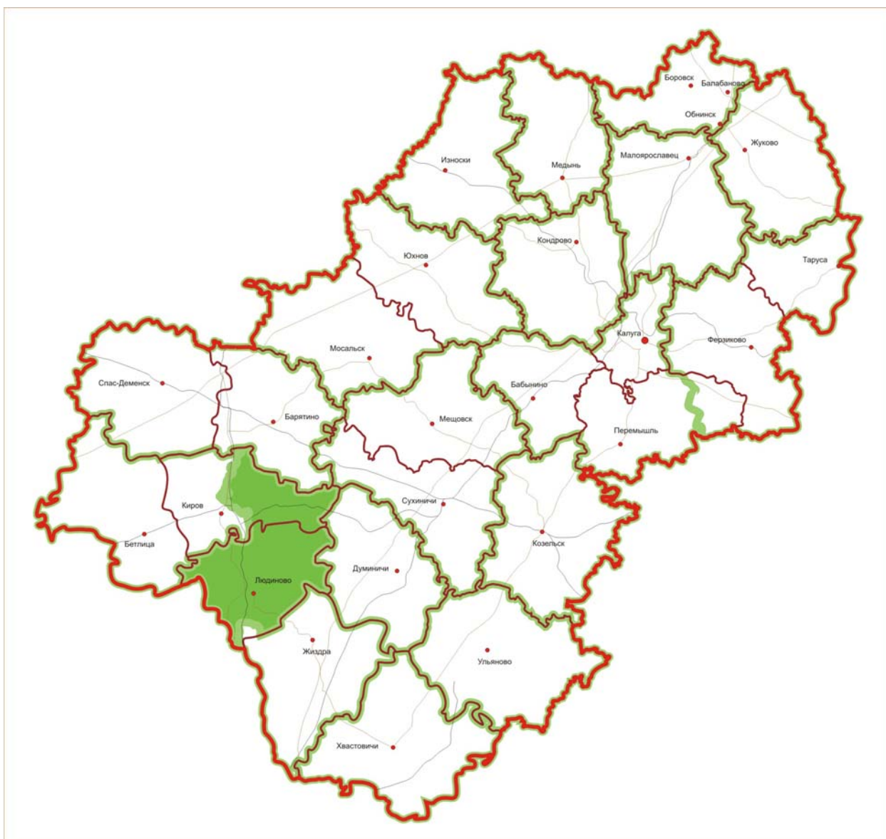
Рис. 1. Схематическая карта расположения Людиновского лесничества на территории Калужской области

Границы лесничества на схематической карте Калужской области показаны на рис. 1.