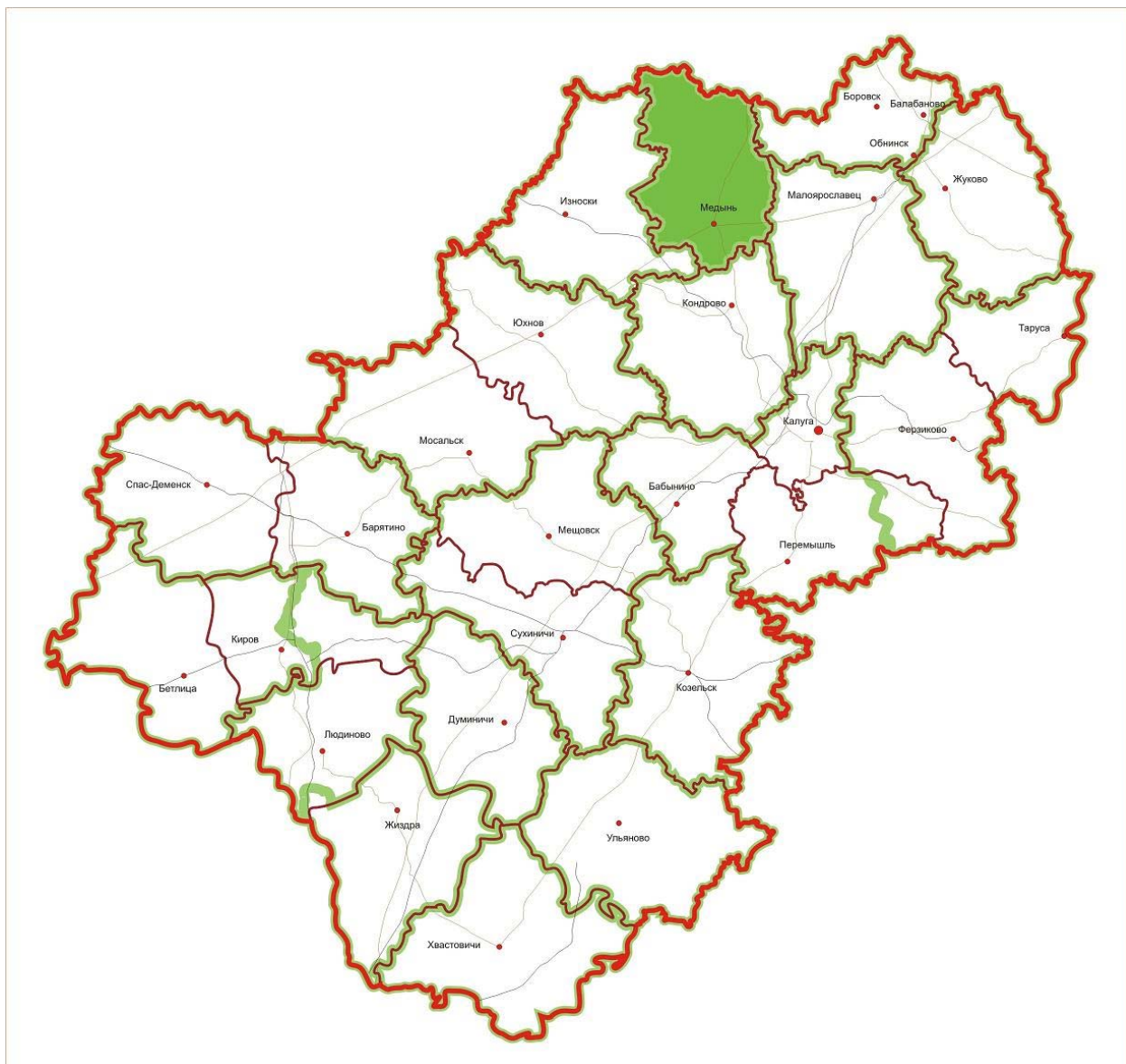
Рис. 1. Схематическая карта расположения Медынского лесничества на территории Калужской области

Границы лесничества на схематической карте Калужской области показаны на рис. 1.